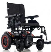
6 Km/h (Max 110 Kg)