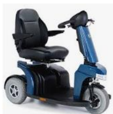
Max 160 Kg (16 Km/h)