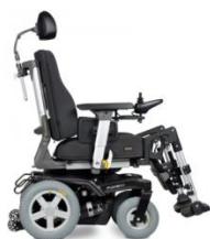
Max 120 Kg (6 Km/h)