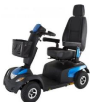
Max 12 Km/h