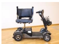
Max 110 kg