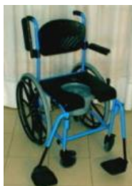
Type A (Max 100 Kg) Roues grandes o petites