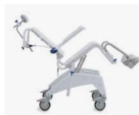
Type D (Max 130 Kg)