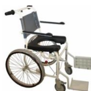
Type B (Max 130 Kg) Roues grandes