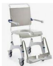
Type C (Max 130 Kg) Roues petites