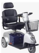
Max 125 Kg (6 Km/h)