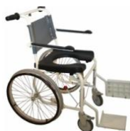
Type B (Max 130 Kg) Roues grandes