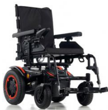
6 Km/h (Max 110 Kg)