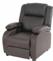
Max 120 kg